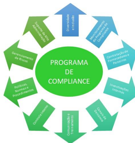
Figura 2 - Programa de Compliance