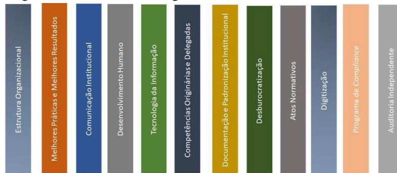
Figura 1: Eixos Estratégicos do Ambiente de Controle: