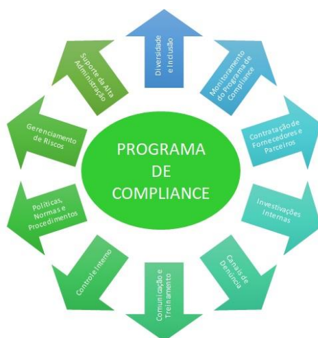
Figura 2 - Programa de Compliance